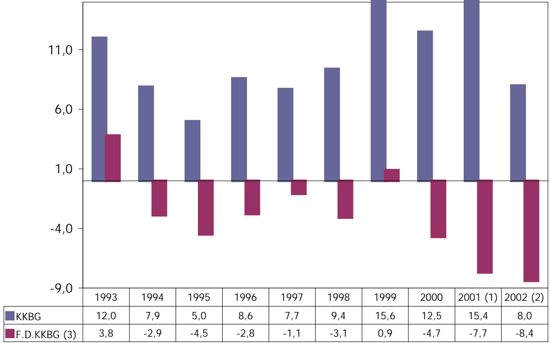
GRAFİK:I- Kamu Kesimi Borçlanma Gereği/GSMH (Yüzde)

(1) Tahmin (2) Program (3) Negatif işaretler fazlayı göstermektedir.